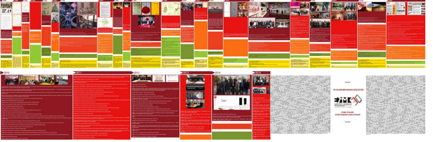
ETMK 30. yıl

ETMK Merkez ve Ankara Şubesinin desteği ile hazırlanan ve ETMK'nın 30 yıllık yolculuğunu anlatan "ETMK 30. yıl" ve "30 Yılda 30 Öğrenci 30 Proje" sergileri yine 16-19 Kasım 2018 tarihleri arasında Haliç Kongre Merkezi'nde sergilendi.